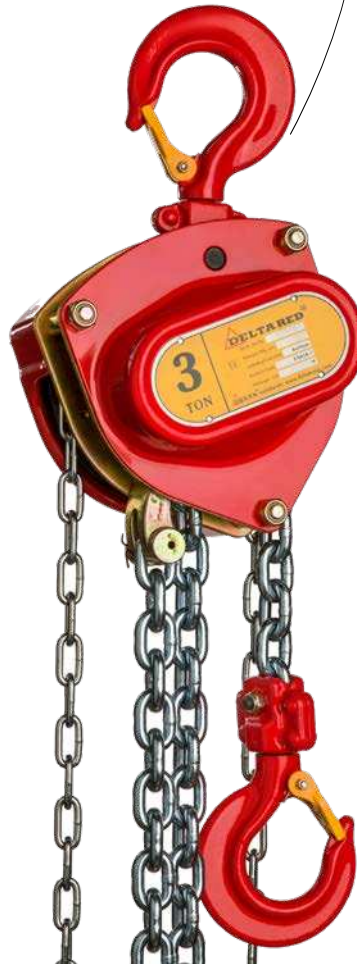
1- strängige Version