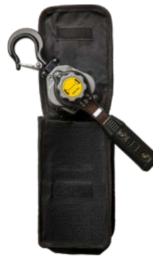
250kg - 500kg